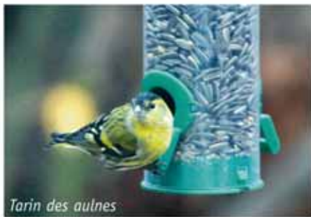
Tarin des aulnes

Vous l'avez sans doute remarqué, le nombre d'oiseaux que l'on peut voir dans nos jardins varie grandement. Cela dépend bien évidemment de plusieurs facteurs : du stade de la végétation, du milieu environnant, des habitudes propre à chaque espèce, du climat, mais aussi des saisons. En hiver, la plupart des espèces ne défendent pas leur territoire avec la même vigueur qu'en période de reproduction. Beaucoup d'oiseaux (dont ceux de la famille des fringillidés, comme les pinsons et les chardonnerets) se regroupent alors. On peut en voir parfois des bandes de plusieurs centaines d'individus. Ces groupes sont constitués pour la plupart d'oiseaux qui se reproduisent dans des contrées plus nordiques et qui ont migré plus au sud. Ils s'ajoutent ainsi aux oiseaux sédentaires. Des espèces hivernantes chez nous, tels le Pinson du nord, le Tain des aulnes ou la Mésange noire, qui se reproduisent jusque dans le nord de l'Europe à l'époque où les graines et les insectes abondent, passent la mauvaise saison dans nos régions où le climat est plus clément.