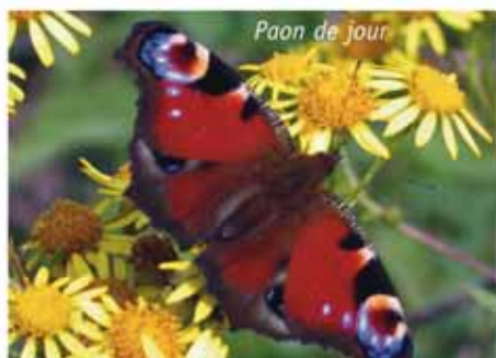
Paon de jour