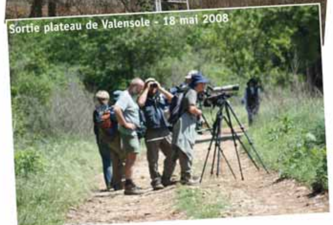
Sortie plateau de Valensole - 18 mai 2008