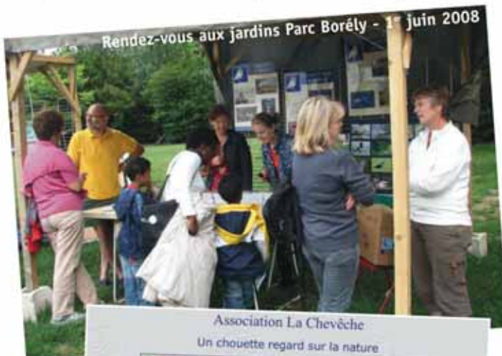
Rendez-vous aux jardins Parc Borély - 1 er juin 2008