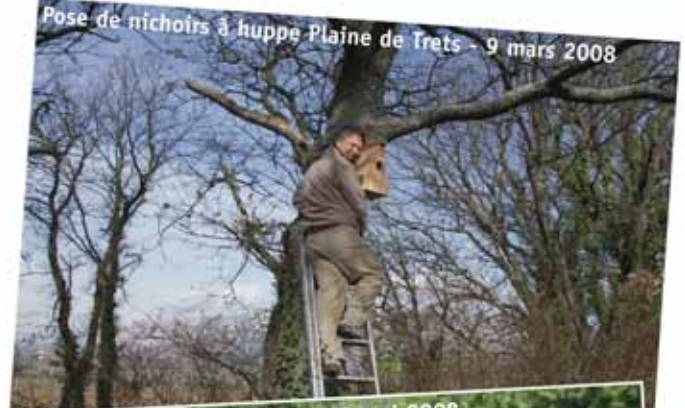
Pose de nichoirs à huppe Plaine de Trets - 9 mars 2008