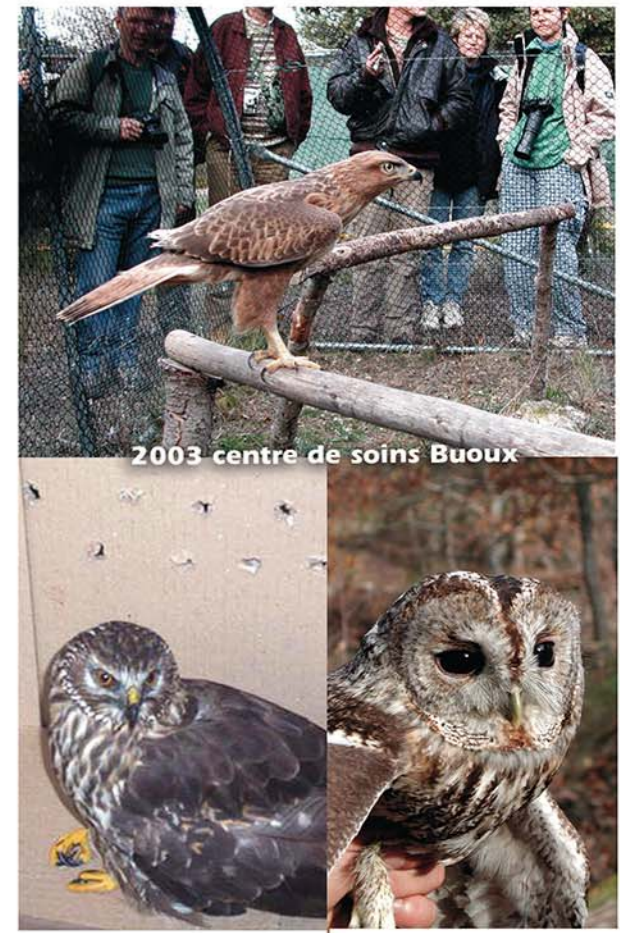
2003 centre de soins Buoux