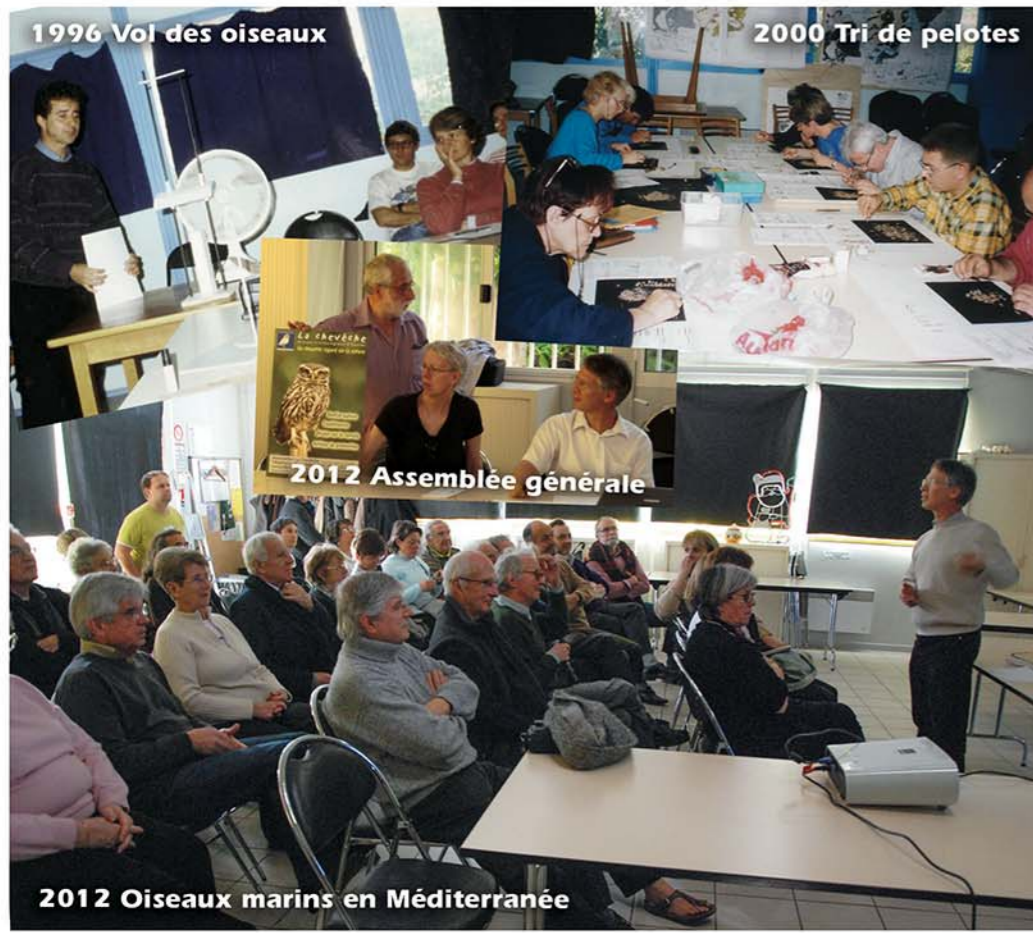
1996 Vol des oiseaux