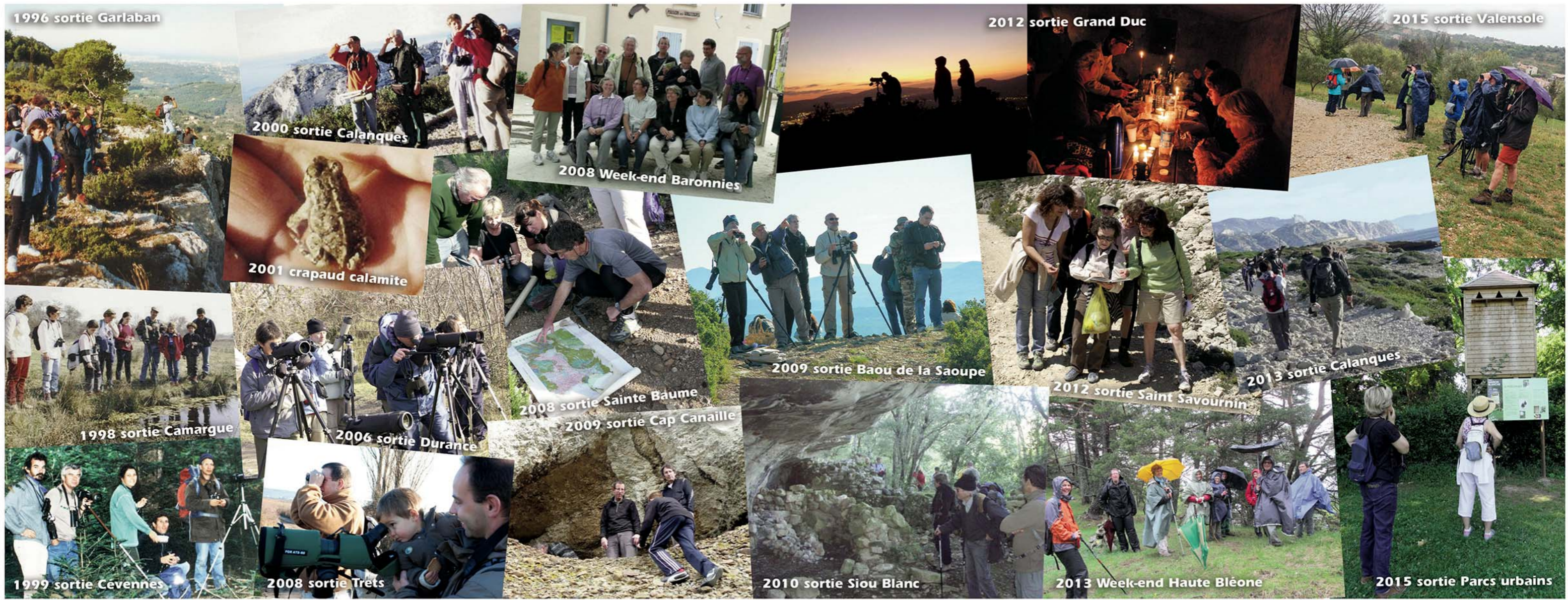
1996 sortie Garlaban