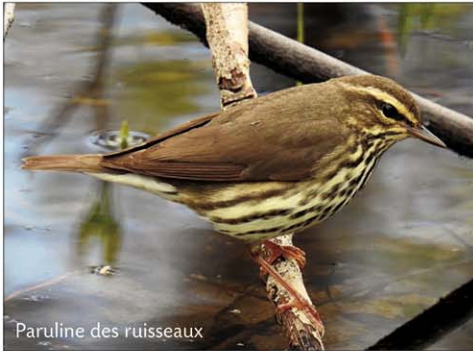
Paruline des ruisseaux

Je m'étais dit que je n'allais pas vous assommer une fois de plus avec le réchauffement climatique, l'augmentation du taux de CO2 atmosphérique ou l'exploitation irraisonnée des ressources de la planète. Pourtant, j'ai assisté en février à une conférence organisée par L'IMÉRA (Institut d'Etudes Avancées) ayant pour titre : " Les rendez-vous de demain - Quelles énergies et quel développement durable". Ce que j'y ai entendu m'a encore une fois consterné.