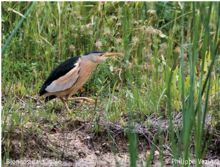
Blongios nain mâle

Que les ornithologues émérites me pardonnent ! La surprise aidant et malgré sa petite taille, j'ai cru voir un Héron bicolore. Après tant d'années passées à La Chevêche, je comprends bien l'accablant de notre ex-président... Un coup d'œil à mon Album Ornitho a achevé de me