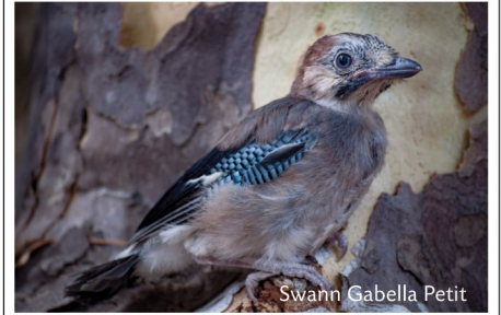
Swann Gabella Petit

Au paradis des oiseaux Volent des milliers d'oiseaux Virevoltant au-dessus des roseaux Leurs ombres se reflètent sur l'eau.